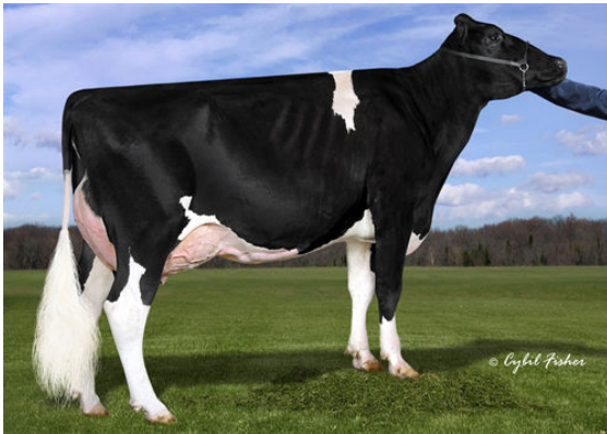
VIEW-HOME MRDIAN IOWA GRANDDAM