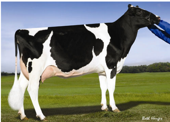
PINE-TREE 2149ROBST 4846 THIRD DAM